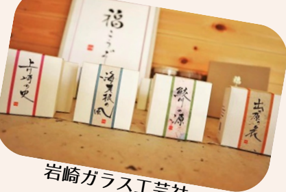
岩崎ガラス工芸社