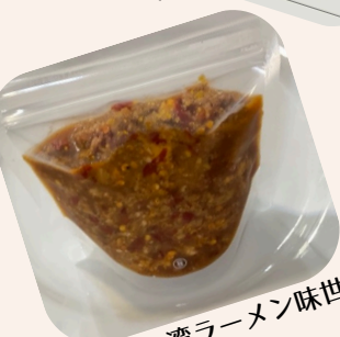
元祖台湾ラーメン味世