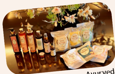
Vedpuran Ayurveda Japan