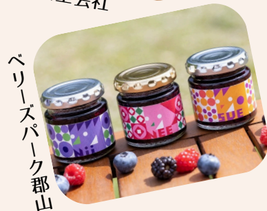
ベリースパーク郡山