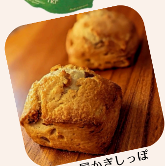
小さなパン屋かきしっぽ